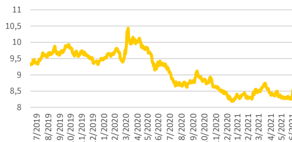
SEK/USD -kurssin kehitys (7/2019 - 6/2021)

Ruotsin keskuspankin (Riksbank) päivittämät SEK/USD-kurssit ajalla heinäkuu 2019 – kesäkuu 2021.